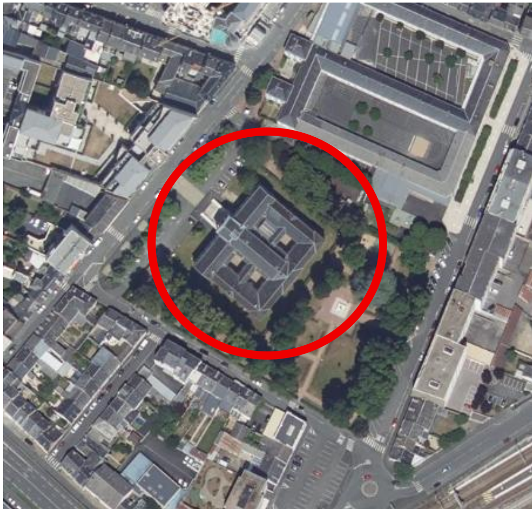
01 : Plan de situation : Image satellite du Tribunal judiciaire de Châteauroux → 1 : 2000°